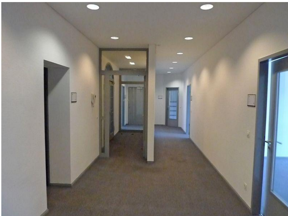
Etageneingang und Flur