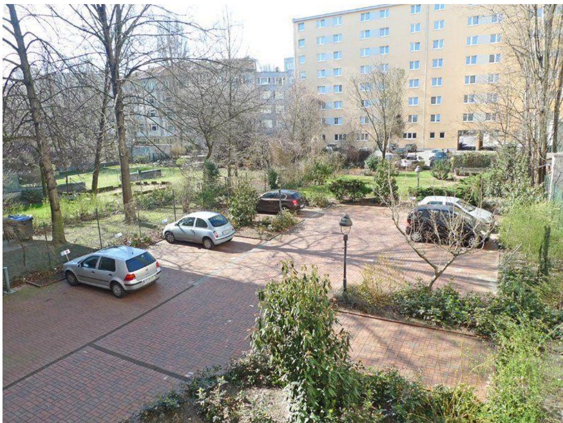
Parkplatz im Hof