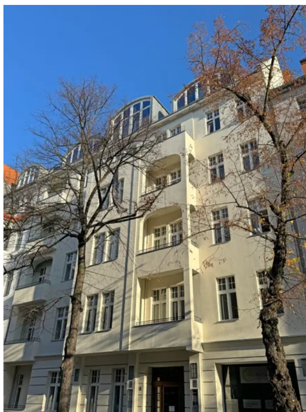
Gebäudeansicht Winter 2024-1