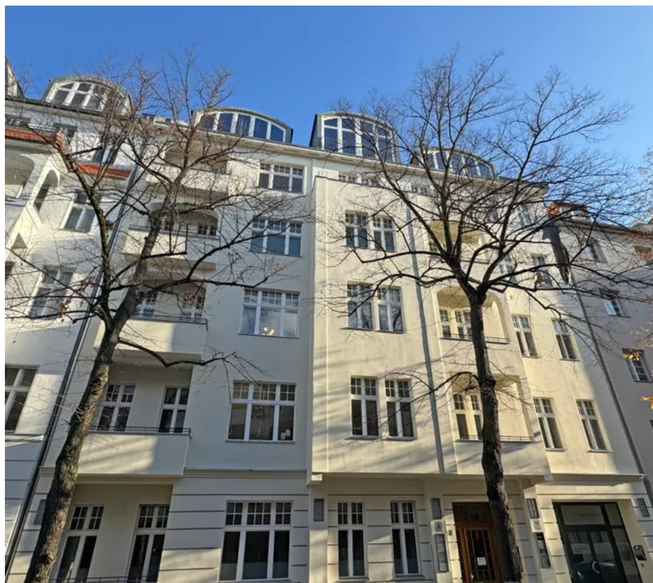
Gebäudeansicht Winter 2024